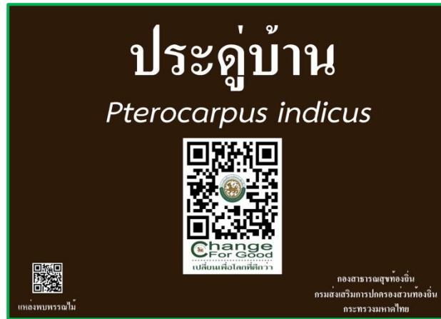
ภาพที่ 1 แสดงรูปแบบป้ายพรรณไม้ท้องถิ่น